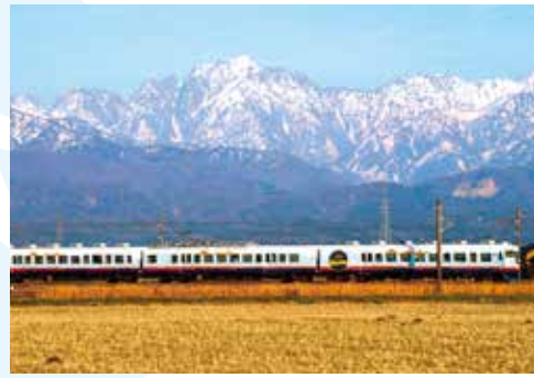
東富山駅 — 水橋駅間

※一万三千尺とはメートル法で約4,000m。立山連峰と富山湾の高低差を表しています。 ※富山湾は平成26年10月、ユネスコが支援する「世界で最も美しい湾クラブ」へ加盟しました。