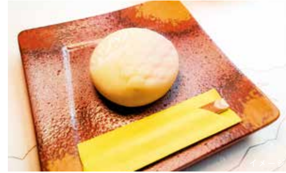
引網香月堂の生菓子

<各コースについて> ※各ダイヤは、変更になる可能性があります。※お料理の内容は季節により変更となる場合がございます。またアレルギー用の代替メニューはご用意しておりません。車内への持ち込み（飲食物）及び車内でお召上がりいただくお食事の持ち帰りはご遠慮いただいております。