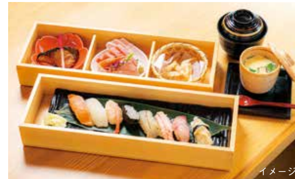
富山湾鮭（「一万三千尺物語」オリジナル）