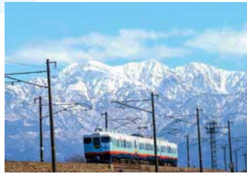
東富山駅 — 水橋駅間