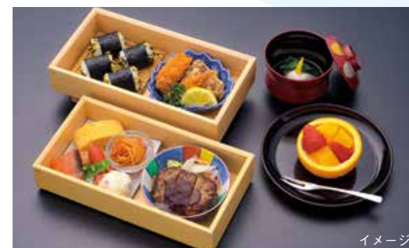
越中懐石コース・子ども料理