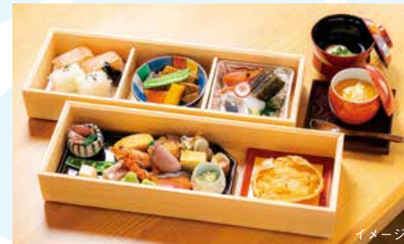
富山の旬を盛り込んだ越中懐石料理