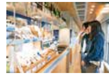
厨房・カウンター (2号車)

旧国鉄車両を用いた客車は、山側に大型窓を設置。天井、床、テーブル等には富山県産の「ひみ里山杉」を使用し、木のぬくもりが感じられる落ち着いた空間です。